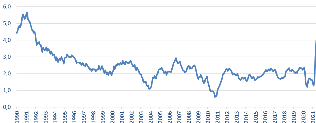
Базовая инфляция в США с 1990 года, % (г/г)

Следующие проинфляционные риски для штатов сохраняются: